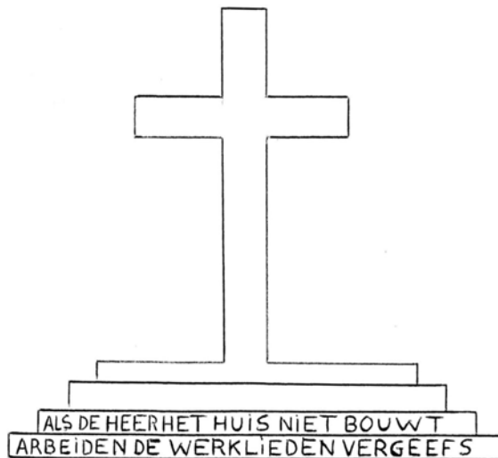
Tekening monument 1945-1949 hoek Waterstraat-Biezenstraat

Mijn vader heeft de tekst dat op het eerste monument staat en jaren geleden verwijderd is uit de bijbel gehaald.