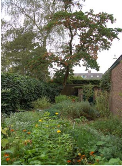
Foto Kloostertuin, plaats van de V1-bominslag