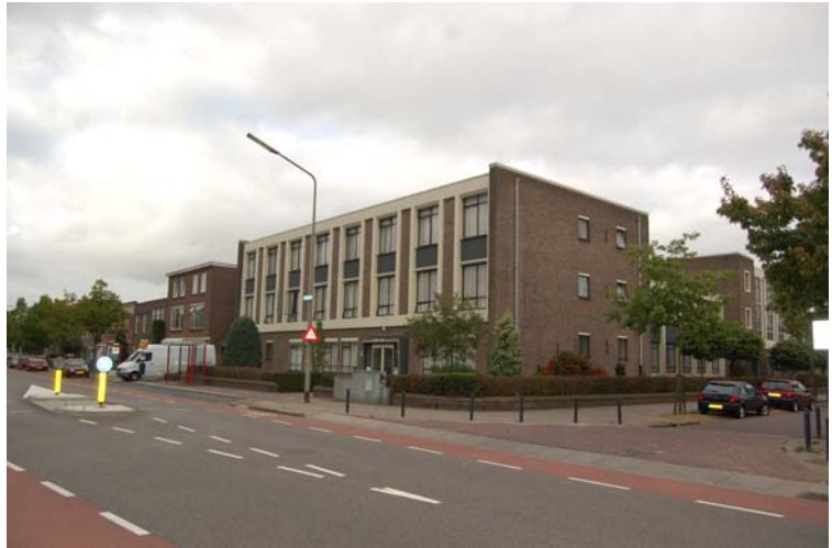
Foto Hoek Waterstraat - Biezenstraat