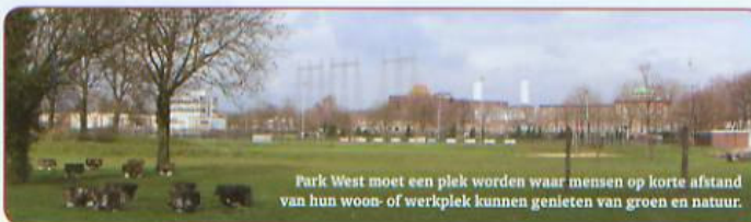
Park West moet een plek worden waar mensen op korte afstand van hun woon- of werkplek kunnen genieten van groen en natuur.

Kijk voor meer informatie op www.nijmegen.nl onder wonen en leven / uw wijk.